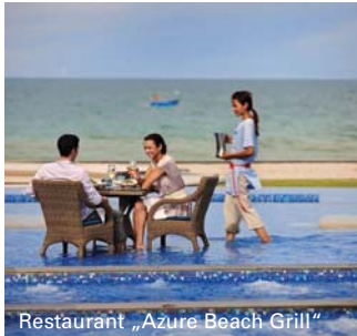
Restaurant „Azure Beach Grill“