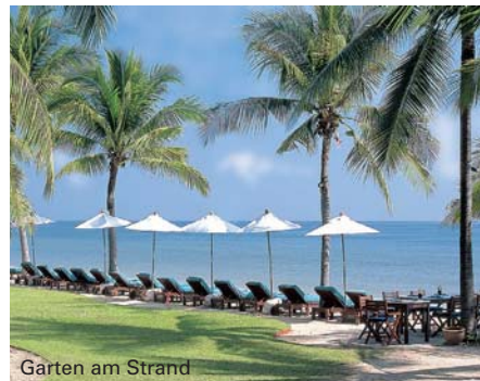
Garten am Strand