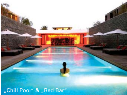
„Chill Pool“ & „Red Bar“