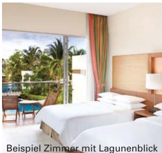
Beispiel Zimmer mit Lagunenblick