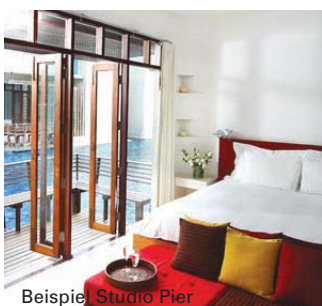
Beispiel Studio Pier