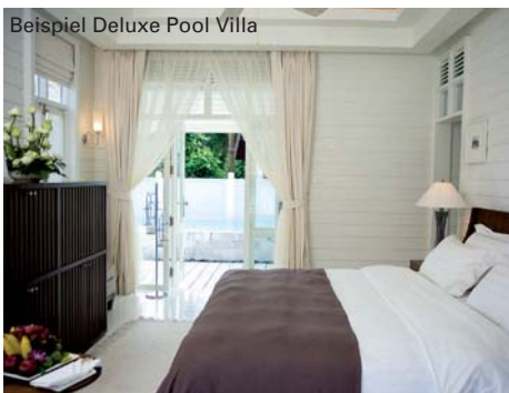
Beispiel Deluxe Pool Villa