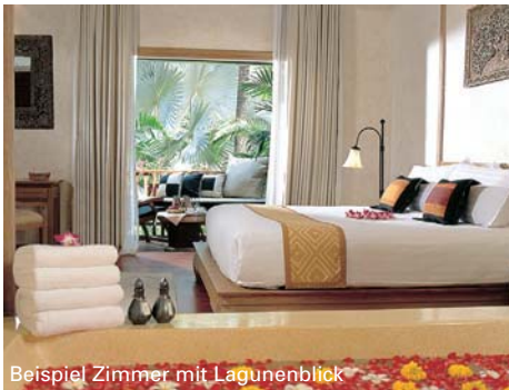
Beispiel Zimmer mit Lagunenblick