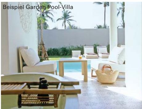
Beispiel Garden Pool-Villa