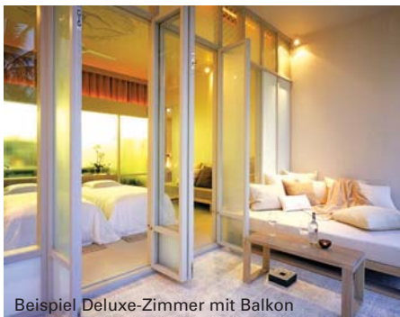
Beispiel Deluxe-Zimmer mit Balkon

Anreise: Zehn Minuten Fahrt zum Flughafen.