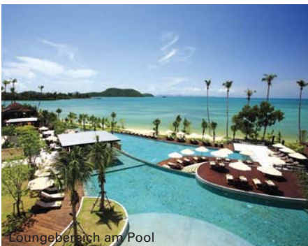
Loungebereich am Pool

Anreise: Ca. 45 Fahrminuten ab Flughafen.