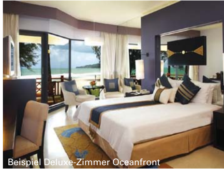
Beispiel Deluxe-Zimmer Oceanfront