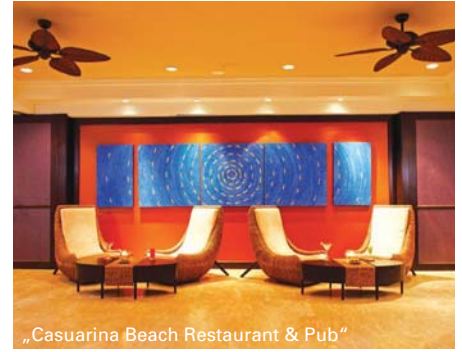
„Casuarina Beach Restaurant & Pub“