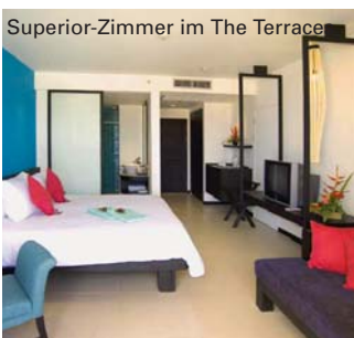
Superior-Zimmer im The Terrace