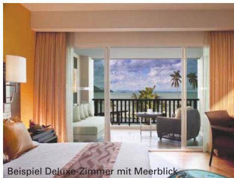
Beispiel Deluxe-Zimmer mit Meerblick