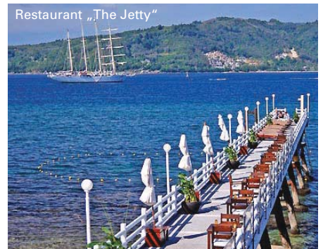
Restaurant „The Jetty“