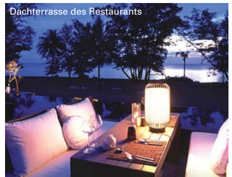
Dachterrasse des Restaurants