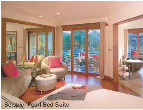
Beispiel Pearl Bed Suite