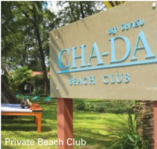
Private Beach Club