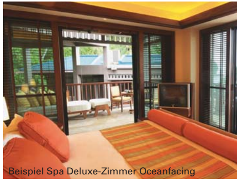
Beispiel Spa Deluxe-Zimmer Oceanfacing