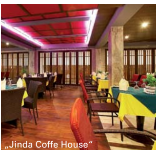
„Jinda Coffe House“