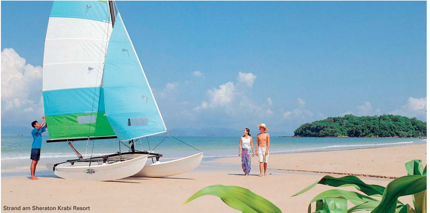
Strand am Sheraton Krabi Resort