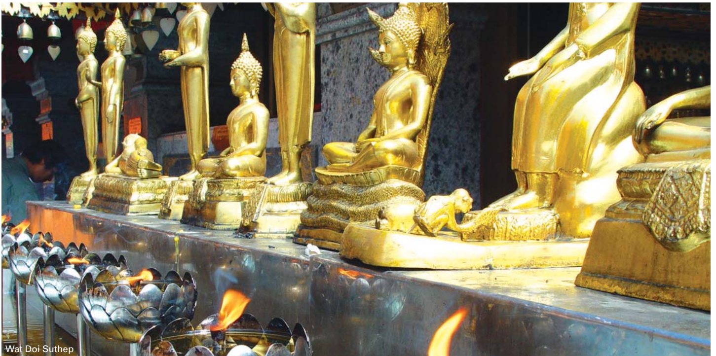
Wat Doi Suthep