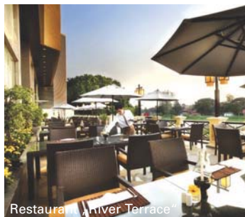
Restaurant „River Terrace“