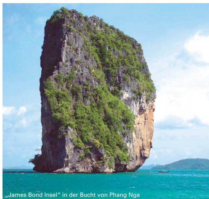
„James Bond Insel“ in der Bucht von Phang Nga

5. Tag: Fahrt nach Udon Thani mit Besuch der Ausgrabungsstätte in Baan Chiang die Funde aus der Bronzezeit zu Tage brachte (UNESCO-Welterbe) und Rückflug nach Bangkok.