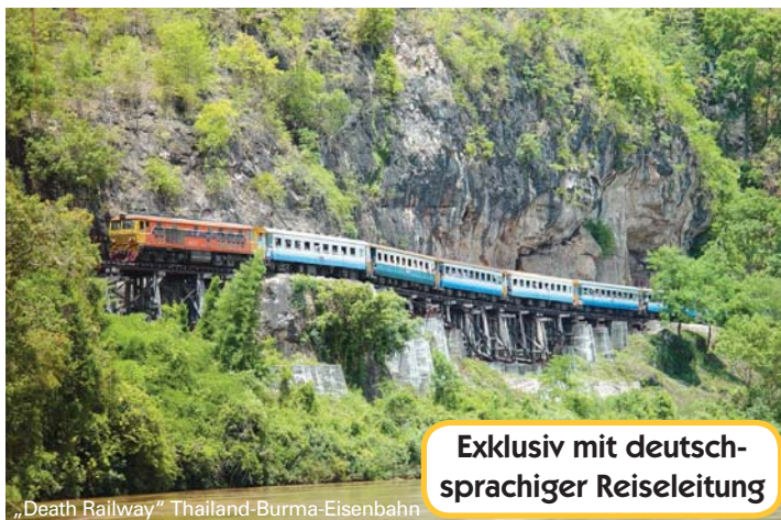
„Death Railway“ Thailand-Burma-Eisenbahn

Exklusiv mit deutschsprachiger Reiseleitung