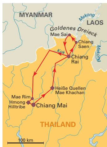
5 Tage „Goldenes Dreieck“ Deutsch-/englischsprachige Reiseleitung, ab/bis Chiang Mai, S. 117