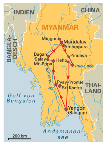
14 Tage „Große Myanmar Rundreise“ Englischsprachige Reiseleitung, ab/bis Yangon, S. 147