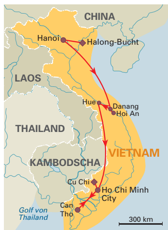
10 Tage „Klassisches Vietnam“ Deutsch- bzw. englischsprachige Reiseleitung, ab Hanoi/bis Ho Chi Minh City, S. 140