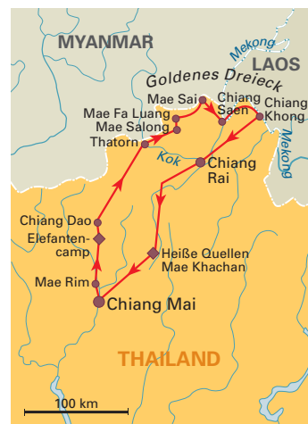
Mietwagenrundreise: 4 Tage „Im Goldenen Dreieck“ ab/bis Chiang Mai, S. 114