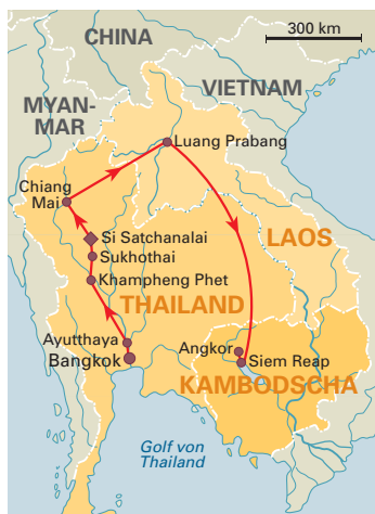
10 Tage „Historisches Thailand, Laos & Kambodscha“ , Deutsch- bzw. englischsprachige Reiseleitung, ab Bangkok/bis Siem Reap, S. 139