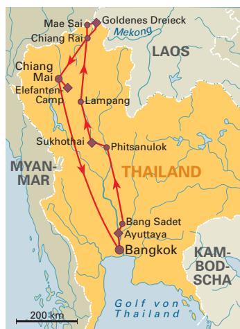
6 Tage „Klassisches Thailand“ Deutsch-/englischsprachige Reiseleitung, ab/bis Bangkok, S. 116