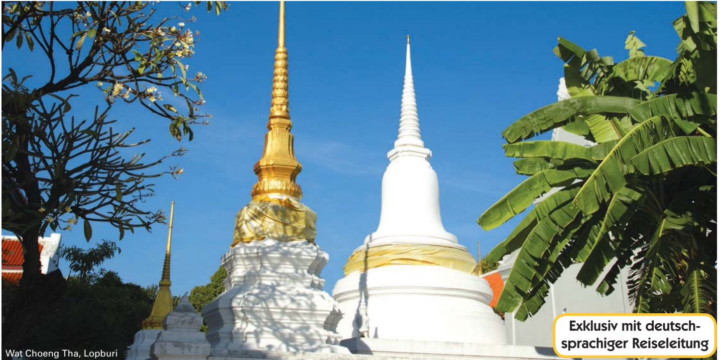
Wat Choeng Tha, Lopburi

Exklusiv mit deutschsprachiger Reiseleitung