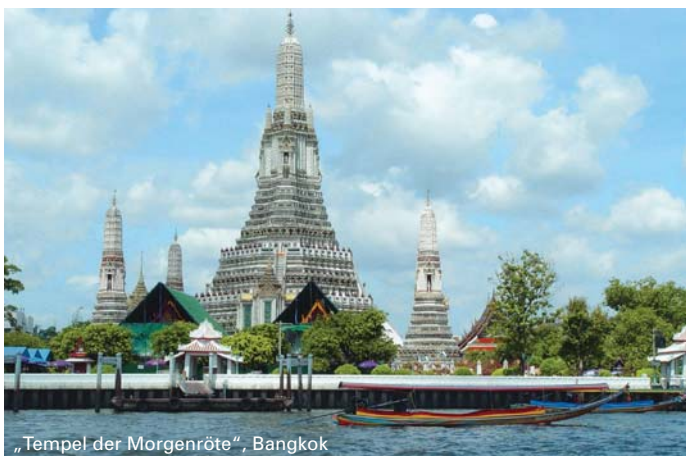
„Tempel der Morgenröte“, Bangkok

2. Tag: Besuch des Sommerpalastes des Königs Rama V. in Bang Pa In. Weiterfahrt im Langboot nach Ayutthaya, der ehemaligen königlichen Hauptstadt Siams. Besuch der historischen Ruinen, die von einstiger Pracht des Reiches künden. Am späten Nachmittag Rückfahrt mit dem Minibus nach Bangkok ins Hotel.