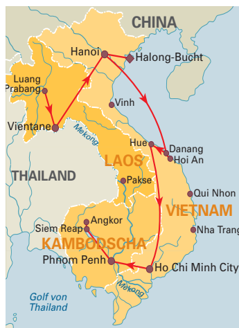
15 Tage „Große Indochina Rundreise“ Deutsch- bzw. englischsprachige Reiseleitung, ab Luang Prabang/bis Siem Reap, S. 136