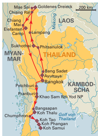
13 Tage „Große Thailand Rundreise“ Deutschsprachige Reiseleitung, ab Bangkok /bis Koh Samui, S. 115