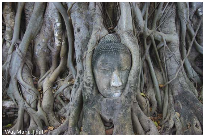
Wat Maha That

Bootstransfer zum Festland. Fahrt zum Flughafen Bangkok oder zum Stadthotel. Ankunft gegen Mittag. Tourende.