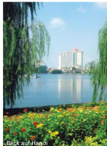
Blick auf Hanoi

Der Tourverlauf entspricht den Tagen 1 bis 7 und 10.