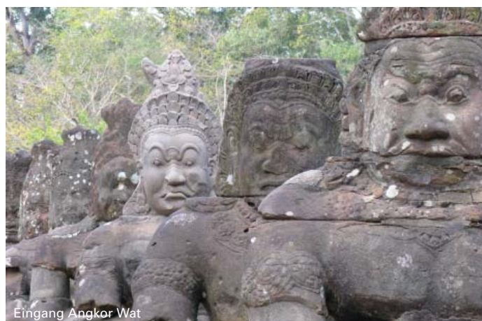
Eingang Angkor Wat

4. Tag: Rückfahrt nach Ho Chi Minh City, wo Ihre Tour am Abend endet.