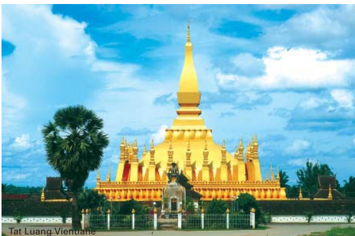
Tat Luang Vientiane

Transfer zum Flughafen und Ende der Rundreise.