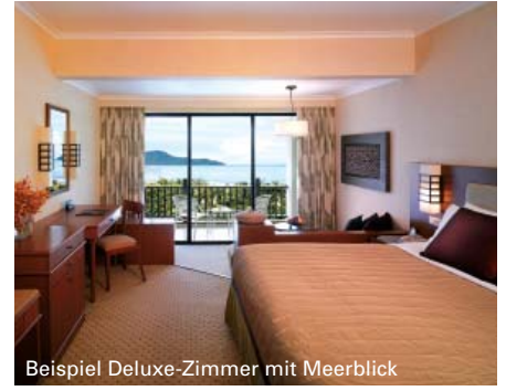
Beispiel Deluxe-Zimmer mit Meerblick