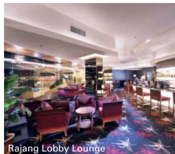
Rajang Lobby Lounge

Das zehnstöckige Haus der internationalen Hotelkette liegt im Herzen von Kuching direkt am Sarawak River mit fantastischem Blick über den Fluss und die bunten malaiischen Dörfer. Die touristischen Attraktionen, wie der Tua Pek Kong Chinese Temple, Fort Margherita und der Basar, sind jeweils nur einen km entfernt. Gleich gegenüber liegt der Sarawak Plaza Shopping Komplex.