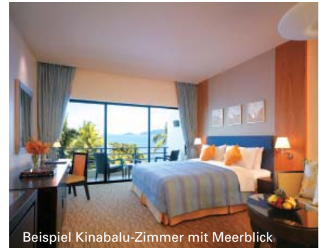
Beispiel Kinabalu-Zimmer mit Meerblick