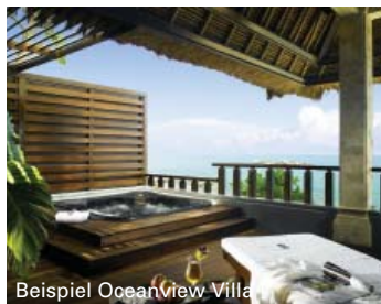
Beispiel OceanView Villa