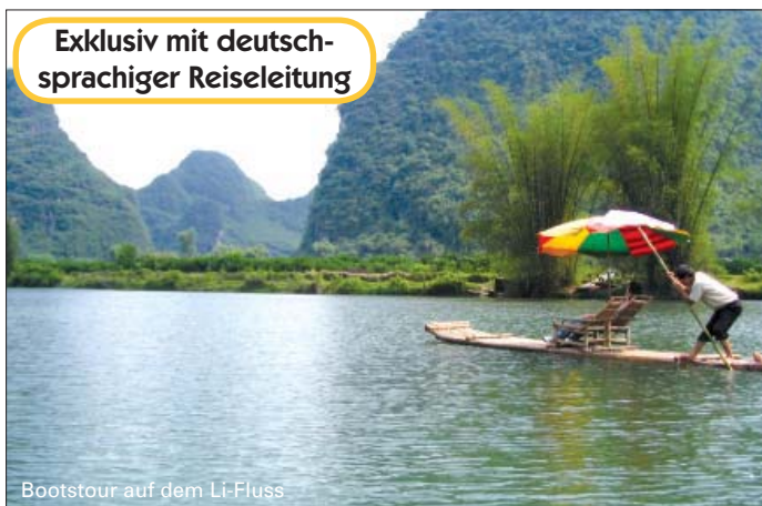
Bootstour auf dem Li-Fluss

Exklusiv mit deutschsprachiger Reiseleitung