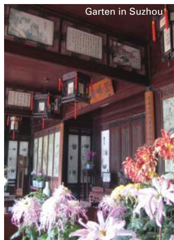
Garten in Suzhou

Nach dem Frühstück Transfer zum Flughafen in Shanghai. Tourende.