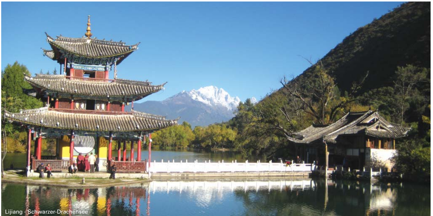
Lijiang - Schwarzer-Drachensee