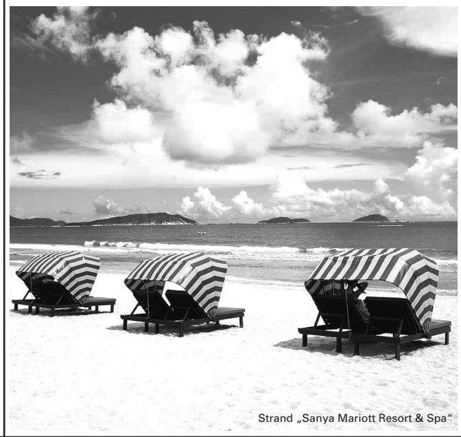
Strand „Sanya Marriott Resort & Spa“