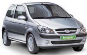
Kategorie Economy z.B. Hyundai Getz

3 Türen, 4 Sitze, Klimaanlage, Handschaltung, Servolenkung, Fahrer- und Beifahrer-Airbags, Radio und CD