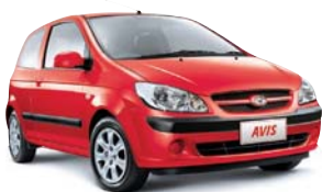
Kategorie X - Economy z.B. Hyundai Getz

3 Türen, 4 Sitze, Klimaanlage, Handschaltung, Servolenkung, Fahrer-Airbag, Radio und CD