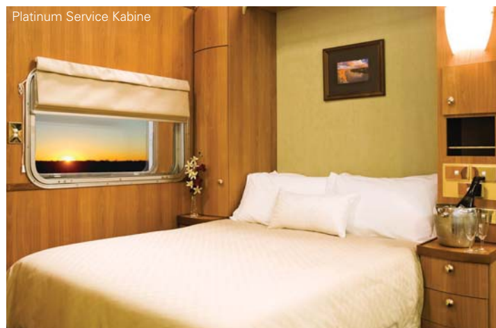
Platinum Service Kabine