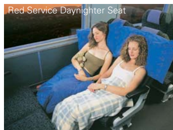
Red Service Daynighter Seat

Für Reisende mit kleinerem Budget ist der Red Service die richtige Wahl. Hier übernachten Sie in einer Zweibettkabine oder einem bequemen Liegesessel mit großzügiger Beinfreiheit. Für das leibliche Wohl sorgt der Red-Service-Speisewagen. Dusche/WC finden Sie in jedem Waggon.