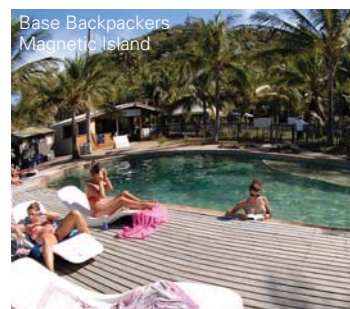
Base Backpackers Magnetic Island