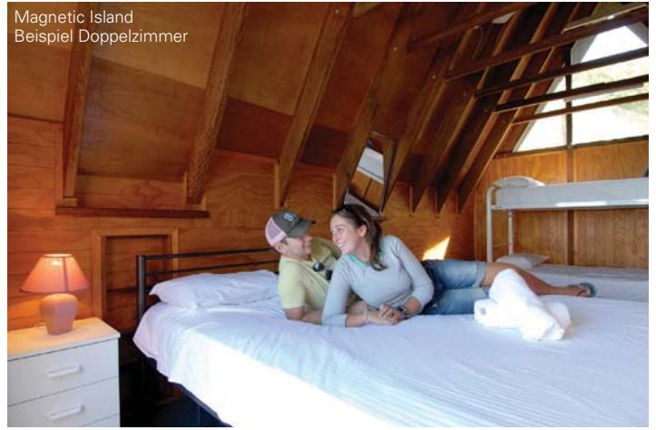
Magnetic Island Beispiel Doppelzimmer