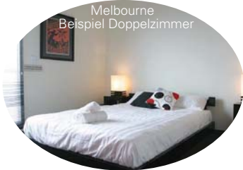
Melbourne Beispiel Doppelzimmer