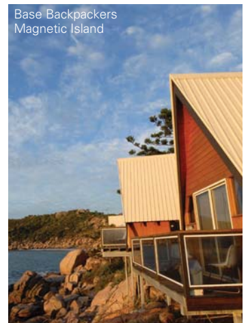
Base Backpackers Magnetic Island