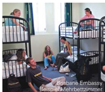
Brisbane Embassy Beispiel Mehrbettzimmer