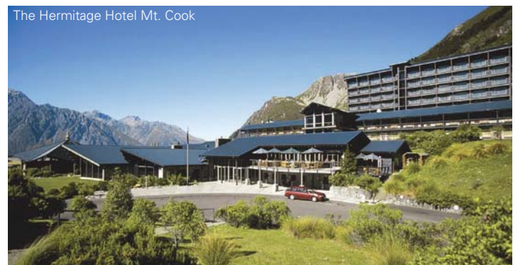
The Hermitage Hotel Mt. Cook

First Class: Gehobene Unterkünfte, meist direkt im Stadtzentrum gelegen.