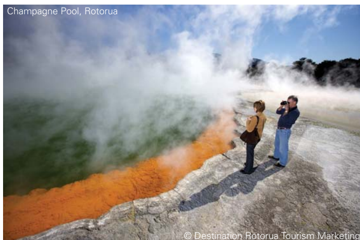
Champagne Pool, Rotorua