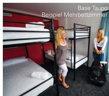
Base Taupo Beispiel Mehrbettzimmer