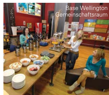
Base Wellington Gemeinschaftsraum