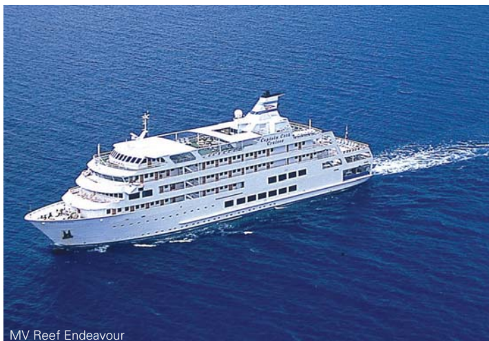
MV Reef Endeavour