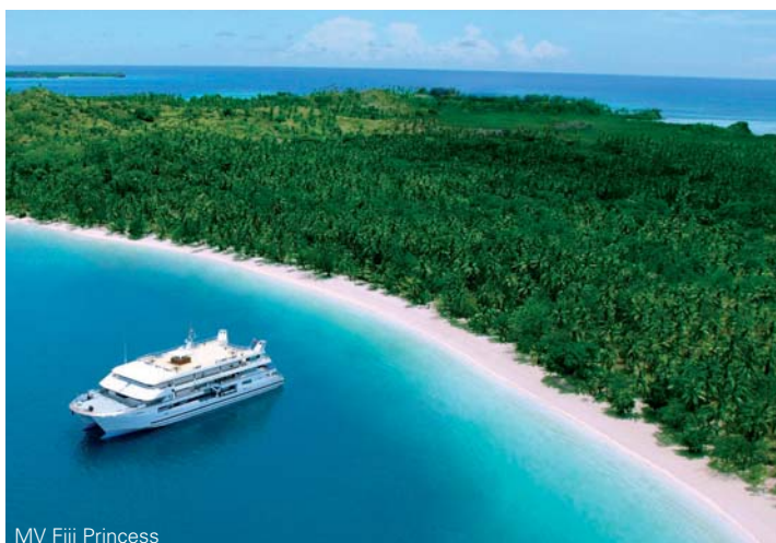
MV Fiji Princess