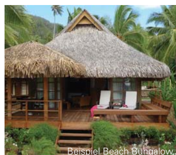
Beispiel Beach Bungalow