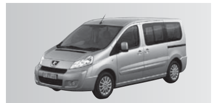
F - Peugeot Expert Combi