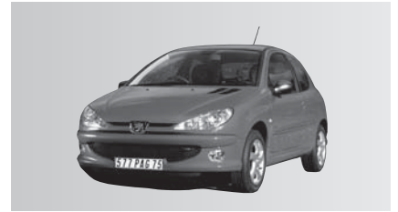
E - Peugeot 206