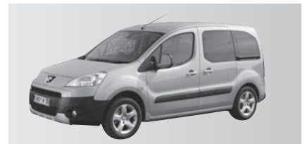
M - Peugeot Partner