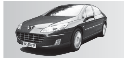
MA - Peugeot 407