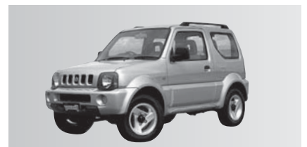
J - Suzuki Jimny