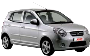
Kategorie A z.B. Kia Picanto, VW Polo Vivo o.ä.

Bitte beachten Sie, dass es sich bei den abgebildeten Fahrzeugen um Fahrzeugbeispiele handelt. Es werden nur Kategorien bestätigt, keine Fahrzeugtypen. Die angegebenen Personen- und Gepäckangaben sind eine Empfehlung des Vermieters. Da Gepäckstücke unterschiedliche Größen haben, sollten Sie eher großzügiger planen. Die günstigsten Preise unserer Mietwagen finden Sie in unserem aktuellen Preisteil und unter: www.explorer.de .