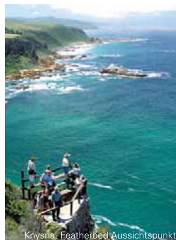
Knysna, Featherbed Aussichtspunkt