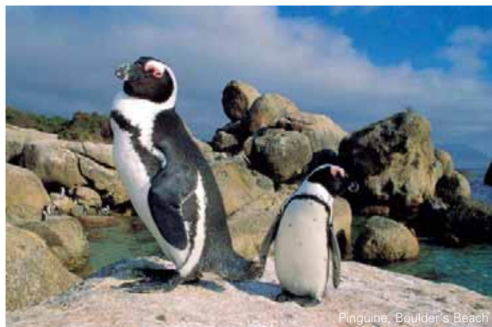
Pinguine, Boulder's Beach