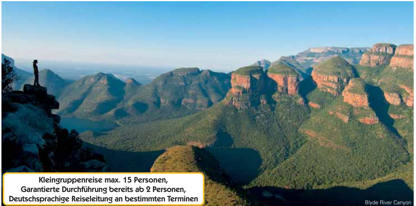
Blyde River Canyon

Kleingruppenreise max. 15 Personen, Garantierte Durchführung bereits ab 2 Personen, Deutschsprachige Reiseleitung an bestimmten Terminen