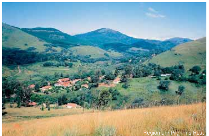
Region um Pilgrim's Rest