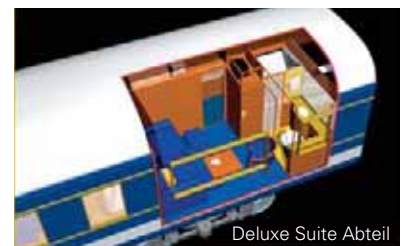
Deluxe Suite Abteil