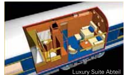
Luxury Suite Abteil