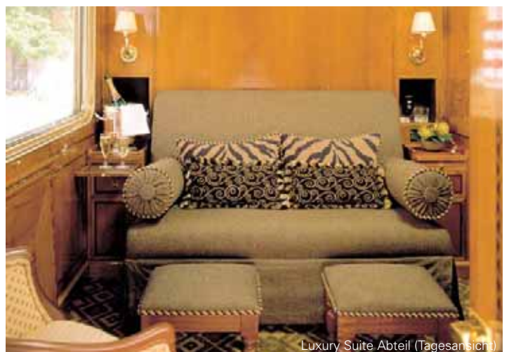
Luxury Suite Abteil (Tagesansicht)