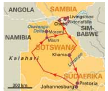
14 Tage Botswana Safari-Abenteuer Camping-Abenteuer, ab/bis Johannesburg, S. 123