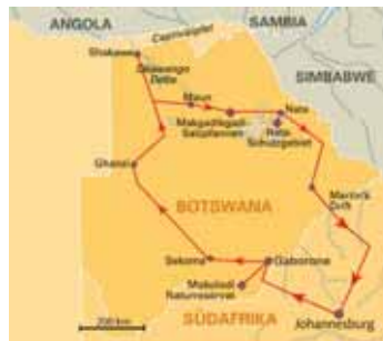
12 Tage Zauber Botswanas ab/bis Johannesburg, S. 119