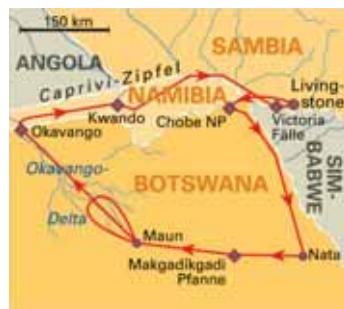
14 Tage Okavango Safari-Abenteuer ab/bis Livingstone, S. 122