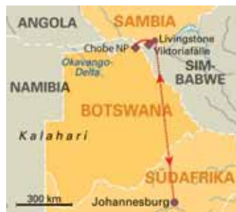
5 Tage Viktoriafälle & Chobe Fly-In Tour , ab/bis Johannesburg, S. 125