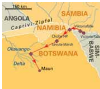
8 Tage Viktoriafälle & Botswanas Höhepunkte , ab Victoria Falls/bis Maun, S. 125