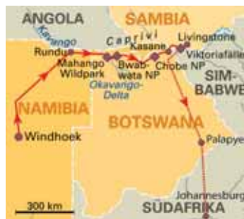
9 Tage Botswana & Viktoriafälle entdecken , ab Windhoek/bis Livingstone, S. 121