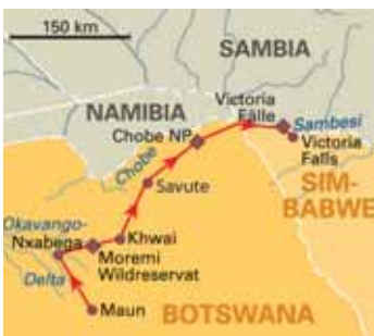
10 Tage Botswana Explorer Camping Deluxe , ab Maun/bis Victoria Falls, S. 120