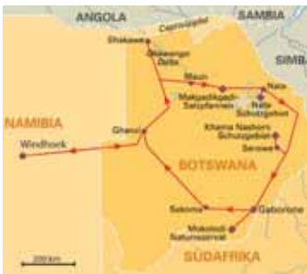
12 Tage Paradiesisches Botswana ab/bis Windhoek, S. 119