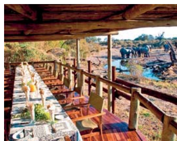
Savute Safari Lodge ★★★★★ - Chobe Nationalpark

Die Lage: Die Lodge liegt ca. vier Ki- lometer vom Flughafen Kasane ent- fernt. Nach Victoria Falls und Livingstone ca. 90 Kilometer.