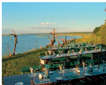
Chobe Game Lodge ★★★★★ - nahe Kasane/Chobe Nationalpark

Direkt am Ufer des Chobe Flusses ge- legen, bietet diese Lodge einen spek- takulären Blick auf den Fluss und die Weite der Caprivi-Überschwemmungs- ebenen. Die einzigartige Tierwelt des Chobe Nationalparks lässt sich von hier aus während interessanter Pirsch- und Bootsfahrten entdecken