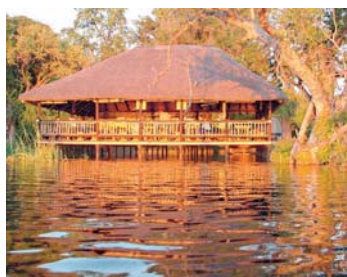
Chobe Safari Lodge ★★★★★ - Kasane/Chobe Nationalpark

Die Lage: In Kasane gelegen, ca. 10 Fahrminuten vom Kasane Flughafen und von Eingang zum Chobe National- park entfernt.