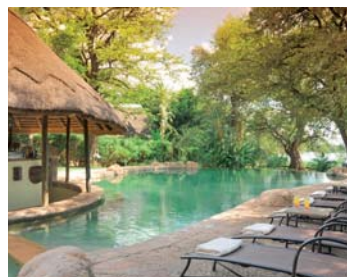
Chobe Marina Lodge ★★★★★ - Kasane/Chobe Nationalpark

Die Lage: Die Lodge liegt ca. 12 Ki- lometer westlich von Kasane und ca. 100 Kilometer westlich von den Vik- torialfällen. Landtransfers ab Kasane, Livingstone und Victoria Falls möglich.