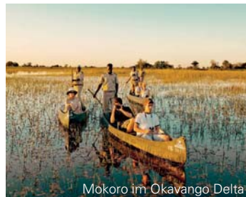
Mokoro im Okavango Delta

Die Lage: Das Camp kann mit dem Allradfahrzeug und per Kleinflugzeug von Kasane oder Maun erreicht werden. Informationen zur Flugreise entnehmen Sie bitte unserem aktuellen Preisteil.