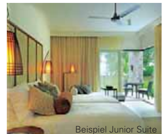
Beispiel Junior Suite