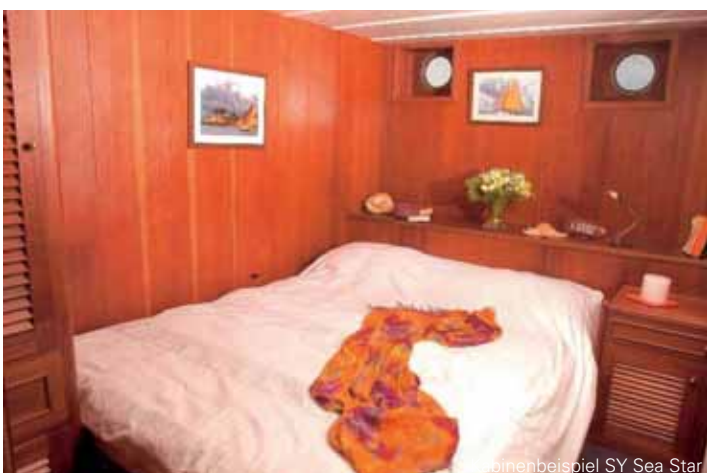
Kabinenbeispiel SY Sea Star