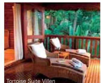
Tortoise Suite Villen

Die Lage: Ab Mahé ca. 30 Minuten mit dem Schnellboot.