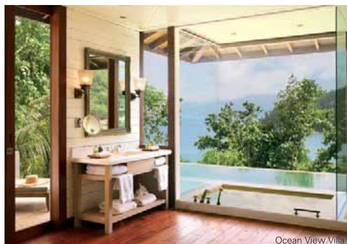
Ocean View Villa

Die Lage: Das Resort liegt ca. 30 Fahrminuten (18 Kilometer) vom internationalen Flughafen entfernt.