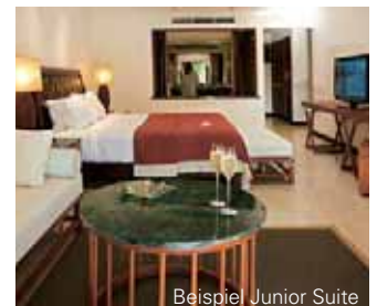
Beispiel Junior Suite