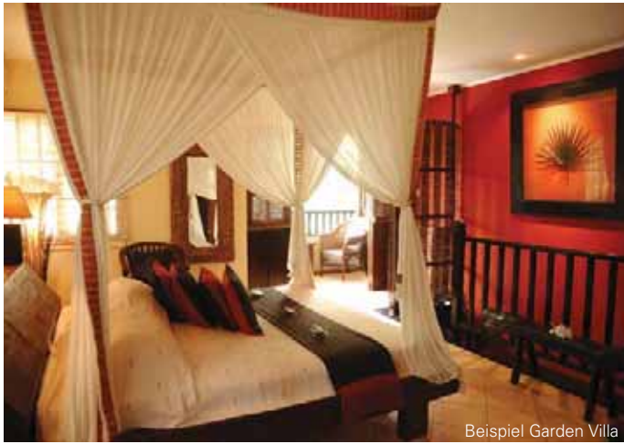
Beispiel Garden Villa

Die Lage: Nur wenige Fahrminuten zum Bootsanleger von La Digue.