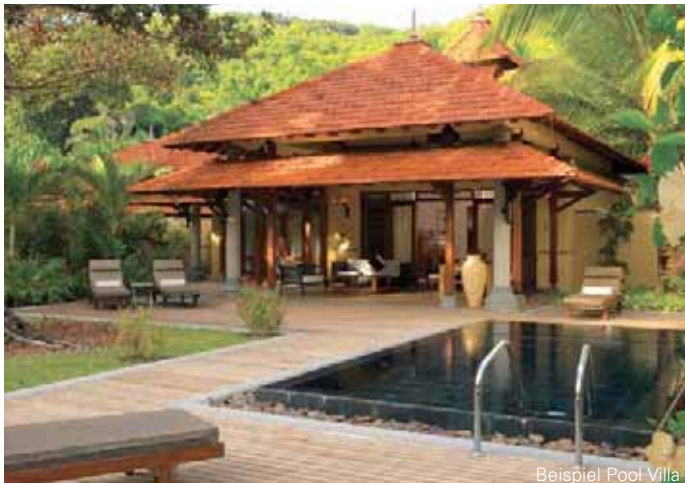
Beispiel Pool Villa