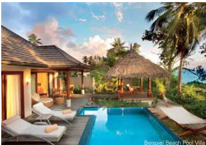
Beispiel Beach Pool Villa