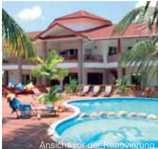
Ansicht vor der Renovierung