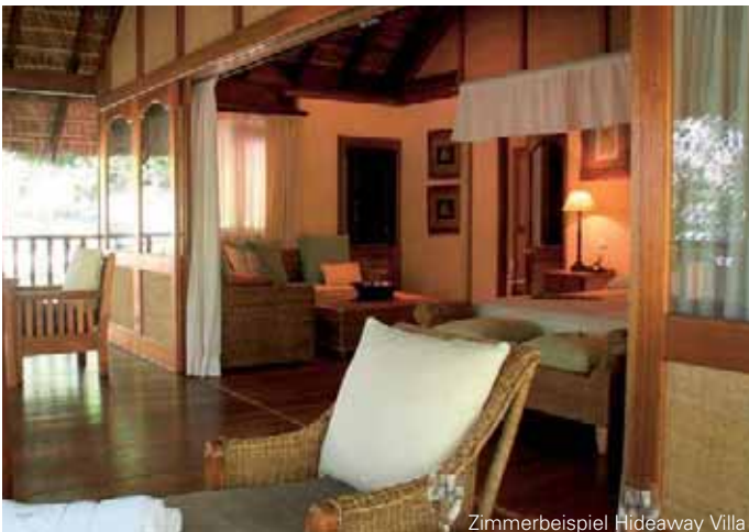
Zimmerbeispiel Hideaway Villa