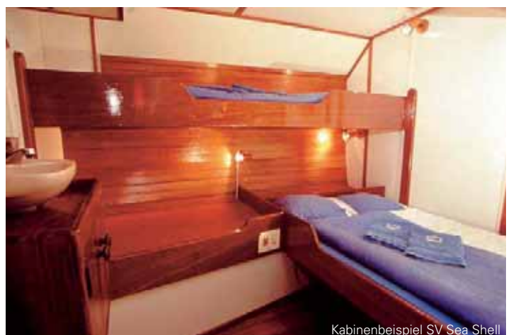
Kabinenbeispiel SV Sea Shell