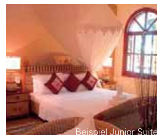
Beispiel Junior Suite