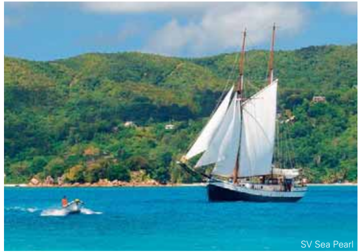
SV Sea Pearl

mit der SY Sea Star oder der SY Sea Bird ★★☆☆