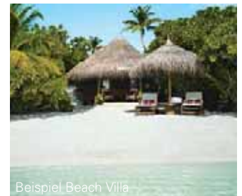
Beispiel Beach Villa

Die Lage: 40 minütiger Panoramaflug mit dem Wasserflugzeug ab Male. Privat-Lounge am Flughafen.