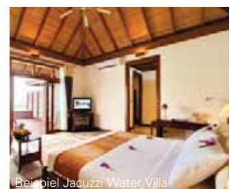
Beispiel Jacuzzi Water Villa