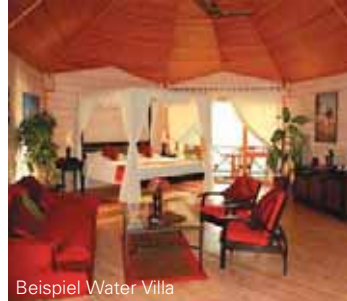
Beispiel Water Villa