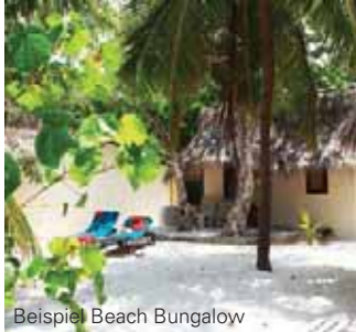
Beispiel Beach Bungalow