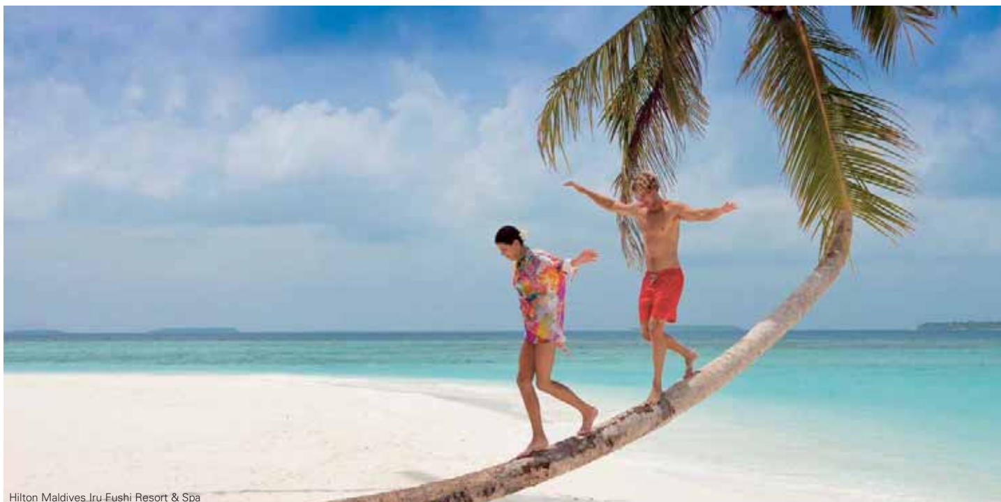
Hilton Maldives Iru Fushi Resort & Spa

Die Malediven - ein Traum aus 1190 Inseln. Im Indischen Ozean gelegen sind die Malediven ein Synonym für weiße Puderzucker-Strände und türkisblaues Wasser. Die bunte, artenreiche Unterwasserwelt zieht vor allem viele Taucher und Schnorchler auf die Malediven. Aber auch Hochzeitsreisende, Paare und Familien finden hier mit Sicherheit ihr ganz persönliches Eiland.