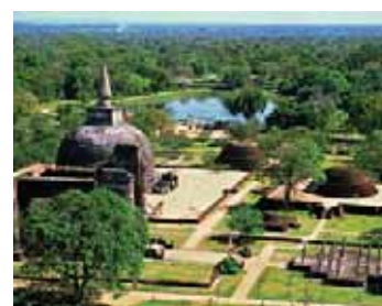
Sri Lanka & Malediven

Die Malediven bieten die richtige Atmosphäre für eine Hochzeit unter Palmen am Strand. Unsere Explorer Reiseexperten informieren Sie gerne über Hochzeitsarrangements sowie über spezielle Preise und Sparmöglichkeiten für Honeymooner.