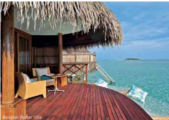
Beispiel Water Villa

Dieses exklusive Resort befindet sich am östlichen Rand des Lhaviyani Atolls auf der 1 km langen und 200 m breiten Insel Kanuhura. Sie ist umgeben von einer türkisblauen Lagune und weißen Traumstränden, wodurch absolute Privatsphäre in einer unberührten Umgebung gewährleistet ist. Das Luxusresort zählt zu den "Leading Hotels of the World" und ist perfekt integriert in eine wundervolle Naturlandschaft. Unweit einiger der schönsten Tauchreviere der Welt, ist die Insel der ideale Ort für Schnorchel- und Tauchausflüge.