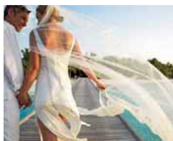
Heiraten im Paradies

Die Malediven bieten die richtige Atmosphäre für eine Hochzeit unter Palmen am Strand. Unsere Explorer Reiseexperten informieren Sie gerne über Hochzeitsarrangements sowie über spezielle Preise und Sparmöglichkeiten für Honeymooner.