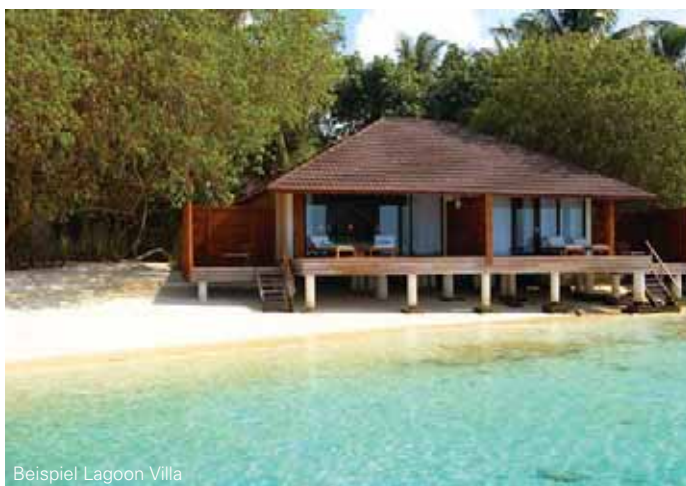
Beispiel Lagoon Villa