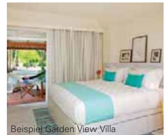
Beispiel Garden View Villa