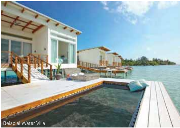
Beispiel Water Villa

Die Lage: Transfer ab/bis Male mit dem Speedboot. Die Fahrtzeit beträgt ca. 40 Minuten.