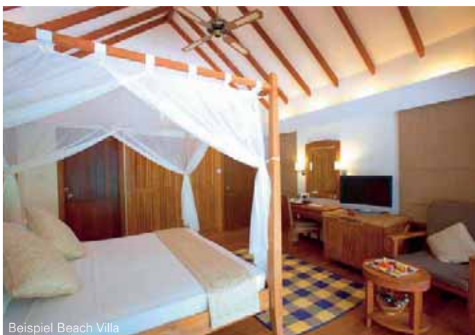
Beispiel Beach Villa