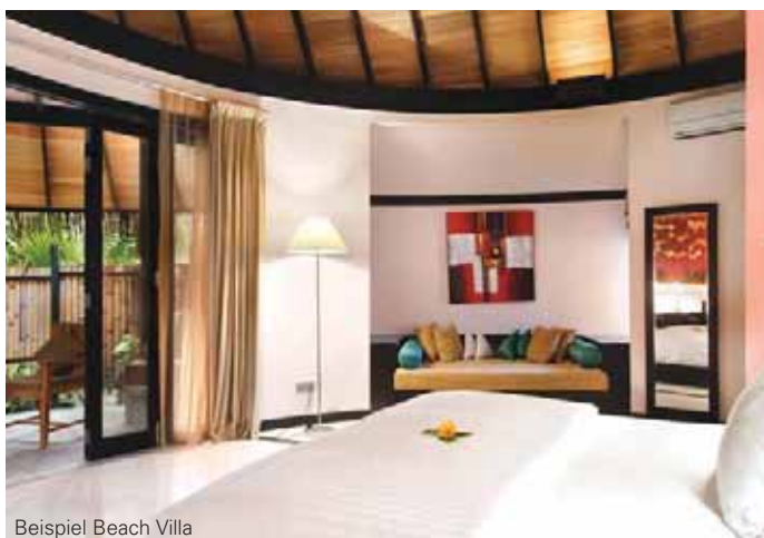
Beispiel Beach Villa