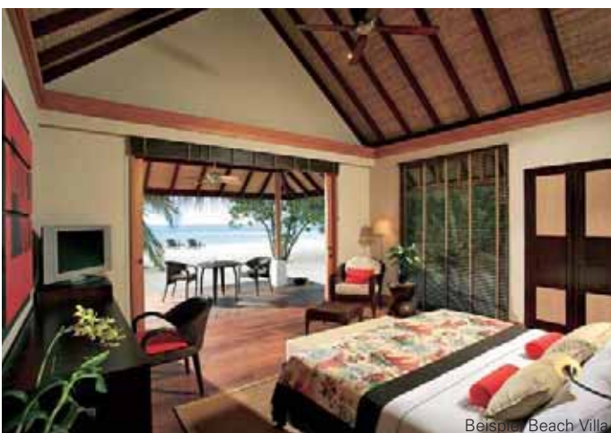
Beispiel Beach Villa

Die 1,8 km lange und 200 m breite Insel Diddhoofinlu im Süden des Ari-Atolls ist ein tropisches Paradies im Indischen Ozean mit perfekten Tauchrevieren. Eingebettet in eine üppige Vegetation und umgeben von einer weitläufigen türkisblauen Lagune mit traumhaft weißen Sandstränden, ist dieses Resort ein Glanzstück der Ruhe voller Luxus und Eleganz.