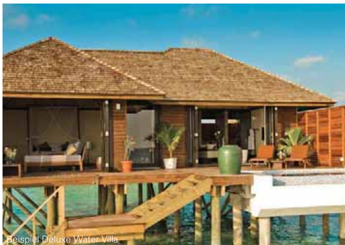
Beispiel Deluxe Water Villa