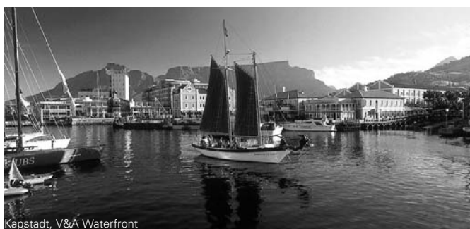
Kapstadt, V&amp;A Waterfront

Fragen Sie immer nach unseren tagesaktuellen Flugpreisen!!!