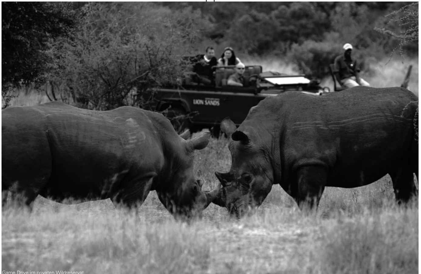
Game Drive im privaten Wildreservat