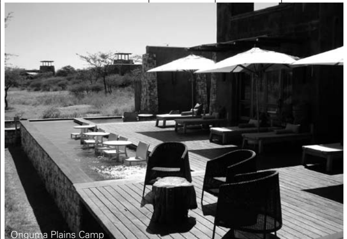
Onguma Plains Camp