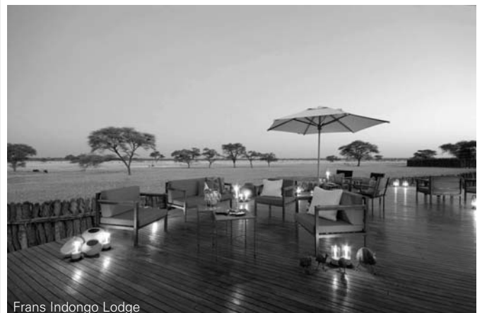
Frans Indongo Lodge

Fragen Sie immer nach unseren tagesaktuellen Flugpreisen!!!