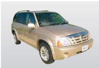
W2 - Suzuki XL-7 mit A/C