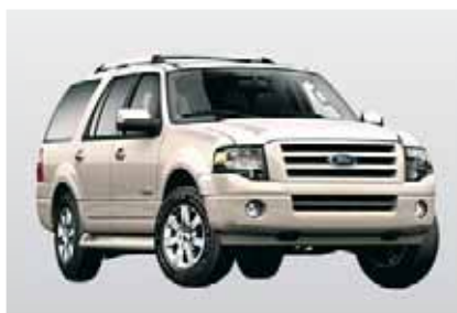
W4 - Ford Expedition mit A/C