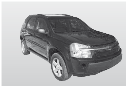
W3 - Chevrolet Equinox/Pontiac mit A/C