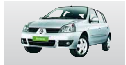
C1 - Renault Clio mit A/C (2 Erw., 2 Ki.)