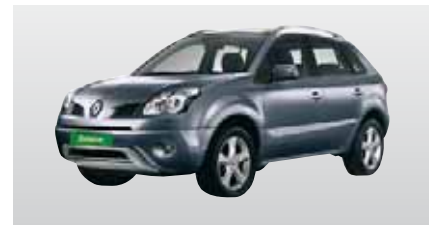
W3 - Renault Koleo mit A/C (2 Erw.)