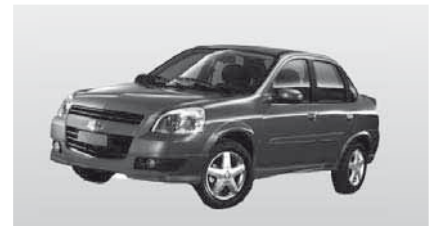
B - Chevrolet Chevy mit A/C (2 Erw.)