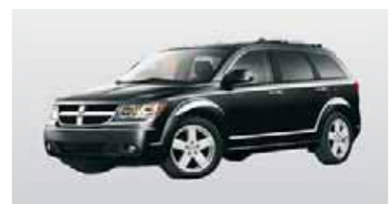
K - Dodge Journey mit A/C (6 Erw.)