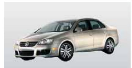
E - VW Jetta mit A/C (4 Erw.)